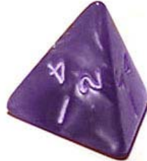
Figuur 1 b : 4-zijdige dobbelsteen

Dit voorbeeld kan model staan voor een worp met (let op!) een 4-zijdige dobbelsteen.